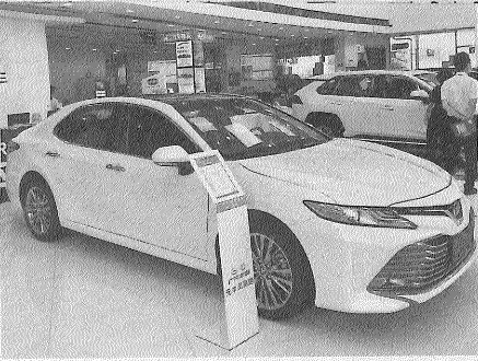
トヨタ自動車はカローラなど 主力車種の販売が好調だった （広東省広州市の販売店）

復に転じ、5月以降は毎 月2割前後の伸びが続 く。競合に比べても品質 やブランドに対する支持 が強く、コロナ問題後に 膨らんでいる新車需要を 取り込んでいる。